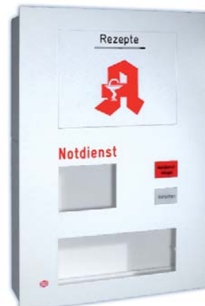
Oder unsere Speziallösungen: Postverteileranlagen oder elektronische Briefkastensysteme für Apotheken und Autohäuser. Lieferbar in Edelstahl, verzinktem Stahlblech oder Leichtmetall.