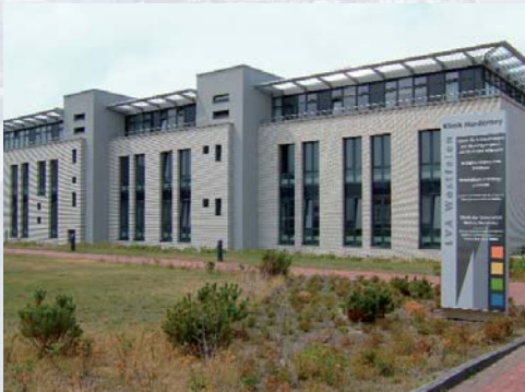
Erweiterungsbau Kurklinik der LVA, Norderney