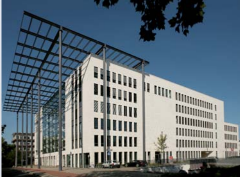
Office Park Rheinlanddamm, Dortmund