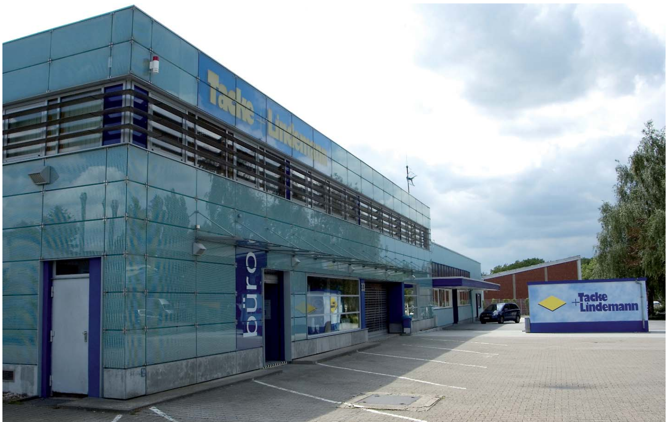
Tacke + Lindemann Baubeschlag- und Metallhandel GmbH & Co. KG - Qualität, Flexibilität und Zuverlässigkeit seit 110 Jahren.

Tacke + Lindemann. Ihr Experte für Präzisionsarbeit und Komplettservice für die Sicherheit rund um die Tür.