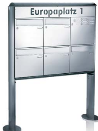
Freistehende Briefkastenanlage: Mit integrierter Beleuchtung, Klingelanlage oder Kamera.