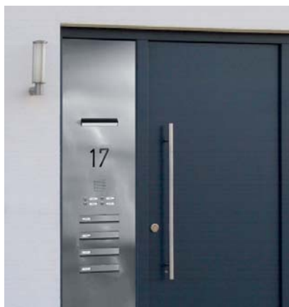
Türseitenteilanlage: Platzsparend, kombinationsfähig und wirtschaftlich.