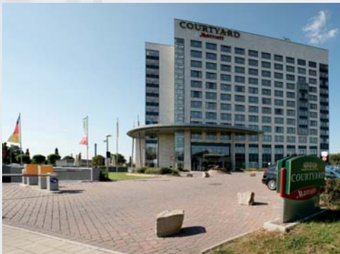
Courtyard by Marriott, Gelsenkirchen