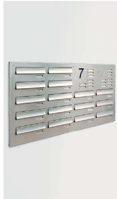
Mauerdurchwurfanlage: Die ideale Verbindung von Funktion und Design. Zur Integration in Mauern oder Mauerstäben.