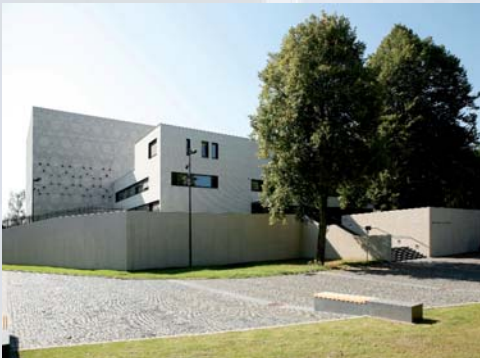
Synagoge der jüdischen Gemeinde, Bochum