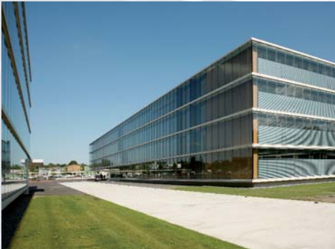
Berufskolleg des Kreises Recklinghausen