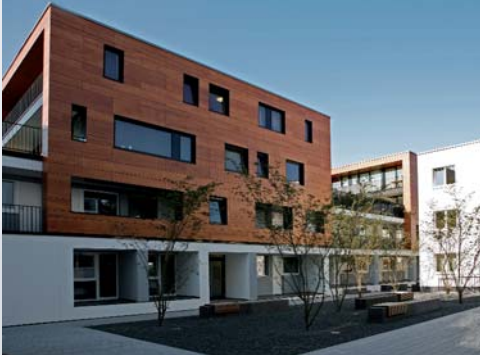
Studentenwohnheim am Aasee, Münster